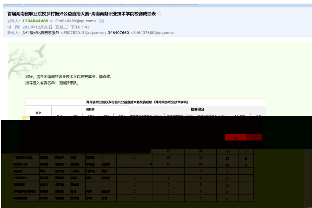
图 湖南商务职业技术学院学生在湖南省首届职业院校乡村振兴直播大赛中获得好成绩

的队。成 的 得 不 对 合 方 的 ， 更 对 公 电 播 导 和 操 的 充 分 。 过 的 度 合 ， 公 不 供 的 播 和 ， 更 比 搭 才 的 ， 、 供 。